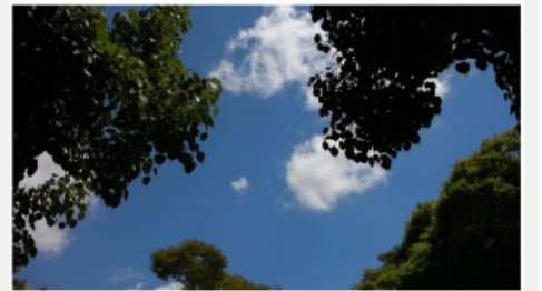
תמר ניסים. היונה